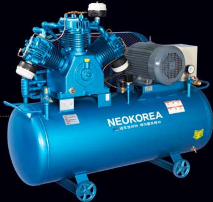
● NKP-520 (20hp/500 ℓ)