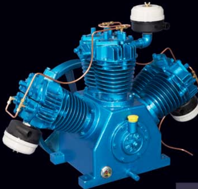
• NKP-20 (2519 ℓ /min)