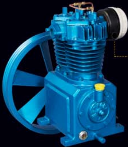
• NKP-5/7 (618~934 ℓ /min)