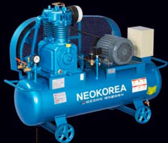
● NKP-7 (7.5hp/148 ℓ )