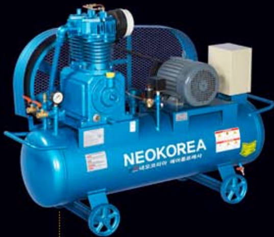
● NKP-5 (5hp/148 ℓ )