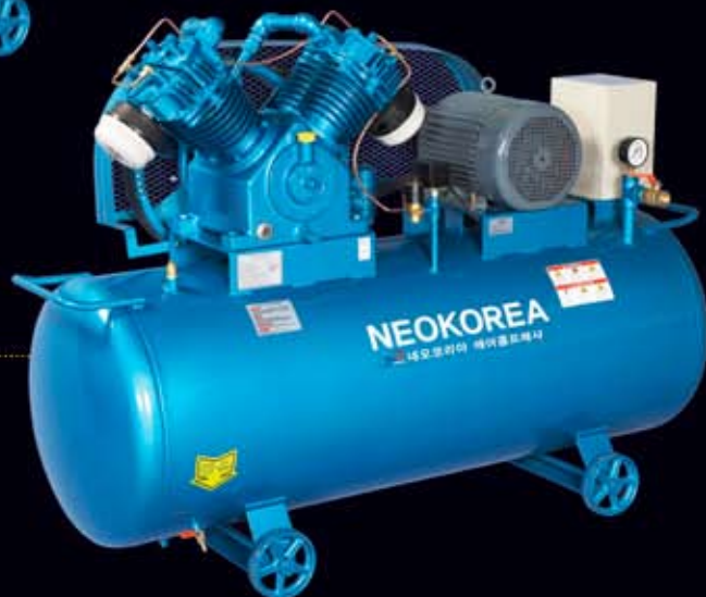
NKP-515 (15hp/500 ℓ)