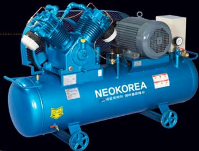
NKP-15 (15hp/280 ℓ)