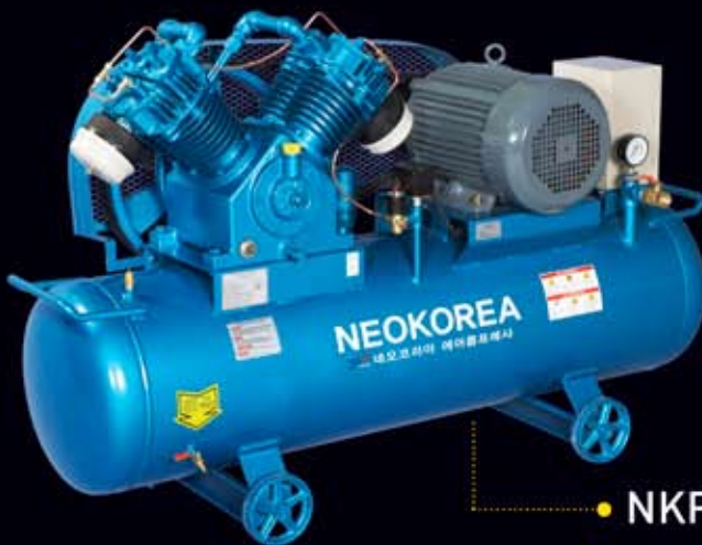
● NKP-10 (10hp/240 ℓ )