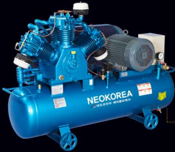
● NKP-20 (20hp/280 ℓ)