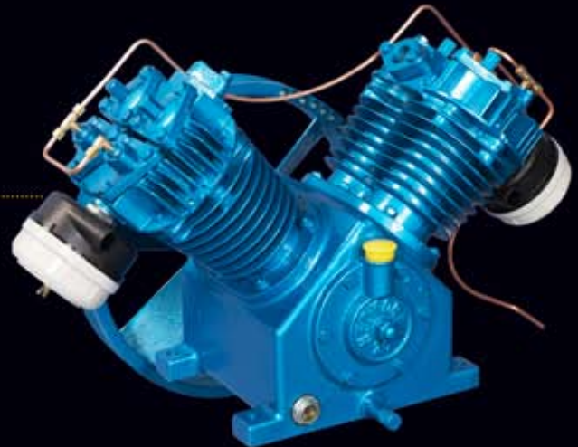
• NKP-10/15 (1272~1909 ℓ /min)